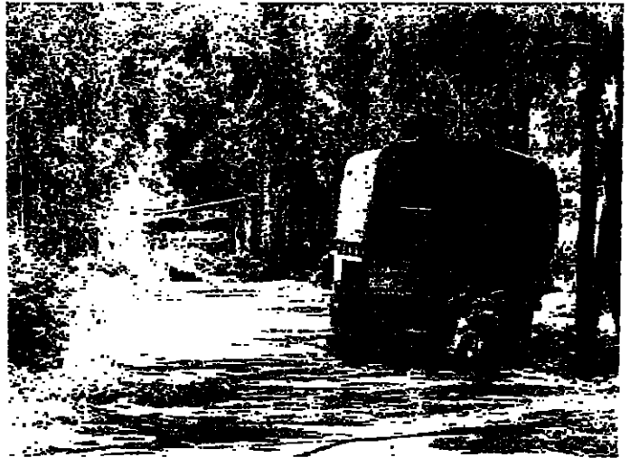
شاحنة عسكرية على طريق البلدة

كتب تزيه نقوزي : صد الجيش اللبناني أمس ببسالة هجوماً إسرائيلياً وأمساً على الجنوب ، استعمل فيه العدو المصمومات الطائرات والثلاثة والرعب بعد الظهر . وقد قامت الطائرات العمودية بصف تجمعات الجيش في وادي عين ابل والقوزج ورميش بقضاء بنت جبيل ، وفي بلدة العزبة بقضاء صور ، فيما عبرت قوات مشاة تقدر بأكثر من ٢٠٠ جندي إلى وادي عيننا الشعب والنلال المحيطة بها ، وانسحبت بعد الظهر وهي تحمل عدداً من التلسي والجرحى . أما خسائر الجيش اللبناني فكانت سبعة شهداء قتلوا داخل مرابضهم في تلة الرجم بعيننا الشعب ، واثنين أصيبا في النصف الجوي . الثامن قاوم وكانت قد وصلت إلى بلدة عيننا الشعب ، لنفقتها بعد الفارة التي قامت بها القوات الإسرائيلية نسي الوحدة فجر أمس ، على مخفر متقدم للجيش ، قتل سبعة منهم ، نسي حين تمكن الثامن من النجاة بمسد ان قام المهاجمين ، وأوقع بينهم خسائر .